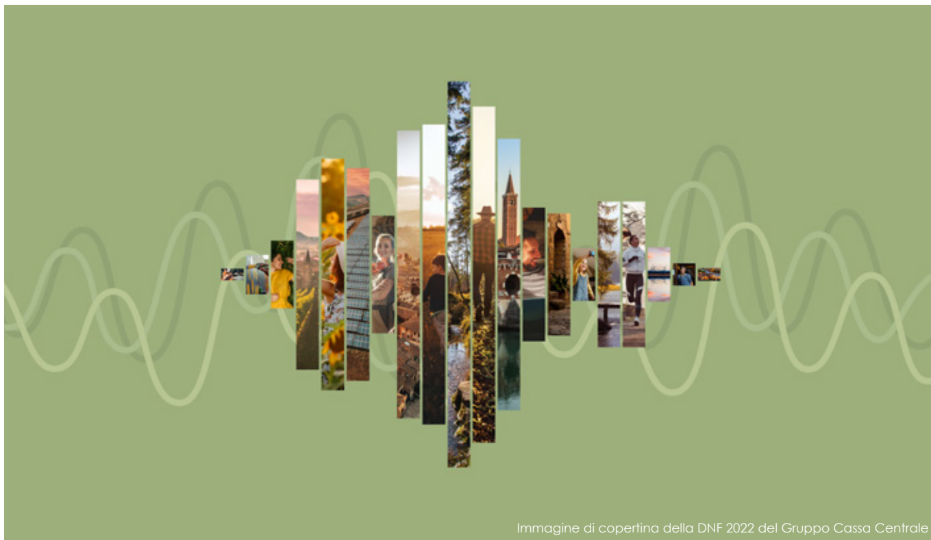
Immagine di copertina della DNF 2022 del Gruppo Cassa Centrale

"L'onda disegnata in copertina è la rappresentazione grafica del suono che ha la parola vicinanza. Rappresenta quello che siamo: vicini. Vicini alle persone e ai territori che serviamo. Rappresenta i valori che ogni giorno guidano la nostra azione. L'onda è quindi l'immagine che abbiamo scelto per raccontarci e per raccontare l'ascolto quotidiano delle comunità."