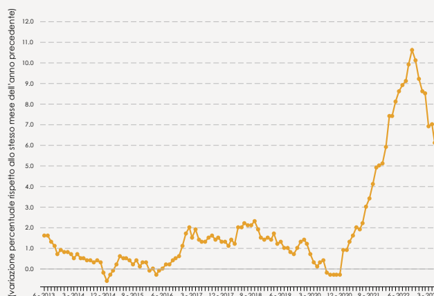
Inflazione nell'Eurozona (M/M-12) (variazione percentuale rispetto allo stesso mese dell'anno precedente)

Per affrontare l'inflazione ed evitare l'erosione dei nostri risparmi è opportuno diversificare la gestione della nostra liquidità con strumenti eterogenei come certificati di deposito, investimenti in fondi di investimento e polizze vita. Ma per muoversi in maggiore sicurezza è sempre bene rivolgersi a consulenti esperti in grado di capire quali sono gli strumenti finanziari più adatti alle proprie necessità.